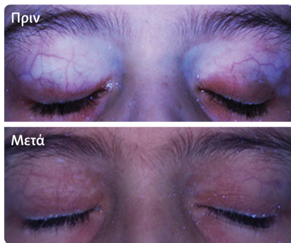
Ασθενής με πλήρη επαναχρωματισμό στα βλέφαρα*