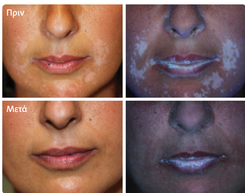
Ασθενής με υψηλό επίπεδο επαναχρωματισμού*

Το 80.0% των ασθενών παρουσίασαν από 76% έως 100% επαναχρωματισμό.