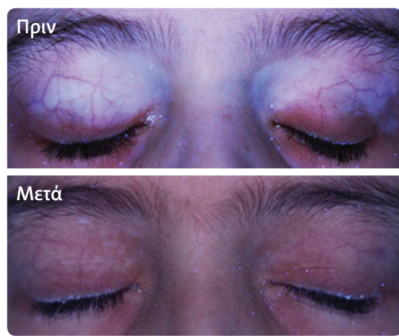
Ασθενής με πλήρη επαναχρωματισμό στα βλέφαρα*